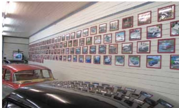
Veggene i bilhallen er dekorert med bilder av alle bilene i klubben. Bildene er nummererte, og en perm med bilder og info om alle bilene ligger for gjennomsyn for de av oss som måtte ønske mer informasjon.