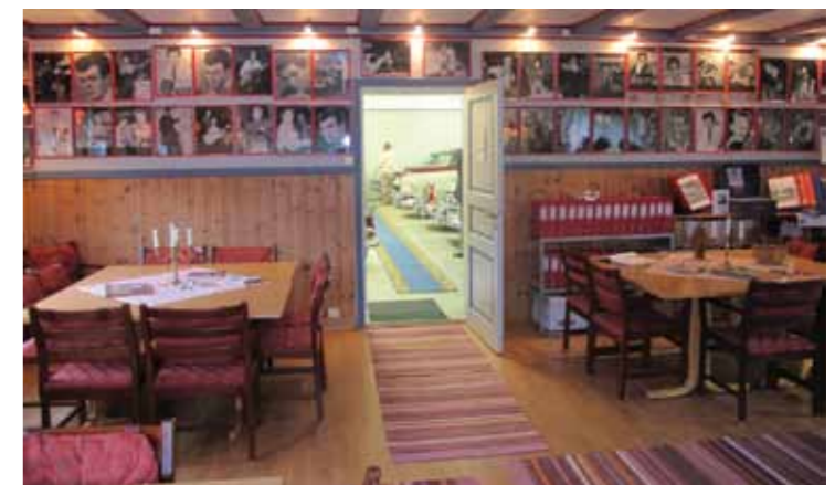
Forsamlingsrommet er dekorert med bilder av legendariske norske rockere. Jack Tveter er ikke bare lidenskapelig opptatt av bil, men vet også alt som er verdt å vite om norsk rock på femtitallet. Her kan man se på bilder og avisutklipp og høre smakebiter av musikken fra den tiden.